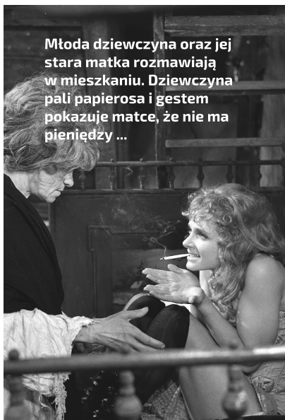
Młoda dziewczyna oraz jej stara matka rozmawiają w mieszkaniu. Dziewczyna pali papierosa i gestem pokazuje matce, że nie ma pieniędzy ...