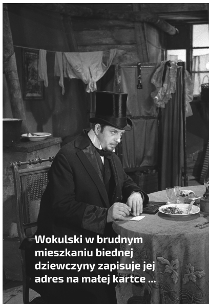
Wokulski w brudnym mieszkaniu biednej dziewczyny zapisuje jej adres na małej kartce ...