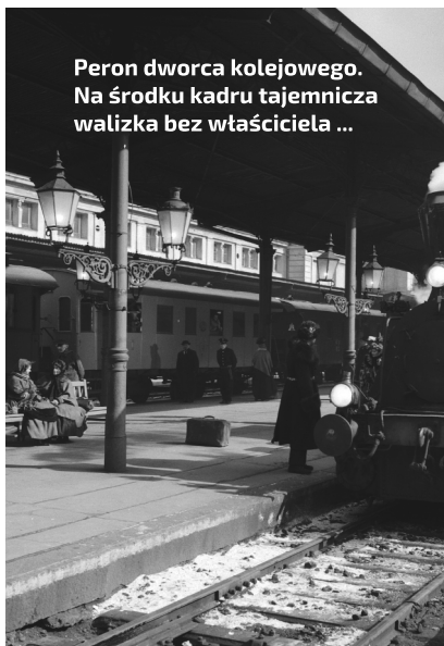
Peron dworca kolejowego. Na środku kadru tajemnicza walizka bez właściciela ...