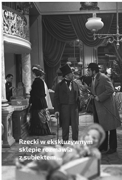
Rzecki w ekskluzywnym sklepie rozmawia z subiektem ...